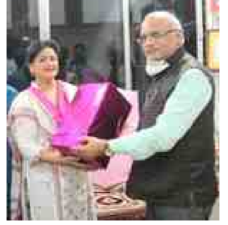
खासदार डॉ. विनय सहस्रबुद्धे यांच्याबरोबर

आता नियमित स्वरूपात प्रबोधिनीत येणं जमत नसलं तरी आजही प्रबोधिनीशी मनातलं नातं दृढ आहे. शाळेने काय दिलं याचा विचार करते तेव्हा आजही आपली अॅजळ मौल्यवान गुणसंपदेनं भरलेली आहे, हे जाणवत रहातं. काळाच्या विविध टप्प्यांवर, मूल्यमापनाचे मनातले मापदंड सुस्पष्ट होत गेल्यावर त्याचं महत्त्व अधिक ठळकपणे लक्षात आलं. प्रबोधिनीसारखी संस्था गेली ५० वर्षं ज्या ध्येयानं आणि निष्ठेनं माणूस घडवण्याचं काम करते आहे ते आजच्या काळात अनन्यसाधारण महत्त्वाचं आहे. हे काम अधिकाधिक वाढवण्याचा आपापल्या परीने प्रयत्न करायला हवा. सुवर्ण महोत्सवाच्या निमित्तानं सुरू झालेले उपक्रम त्या दृष्टीनं प्रशंसनीय आहेत. याच मार्गावर कार्यरत राहण्यासाठी बळ मिळावं म्हणून म्हणावंसं वाटतं, 'अमुच्या शुभ्रतांना आई तुझे शुभाशिष दे...!'