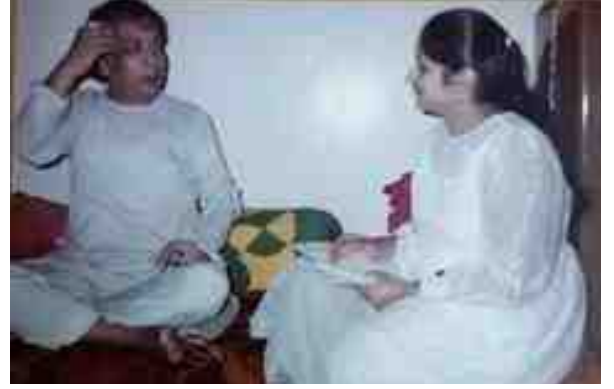
बिरजू महाराज यांची मुलाखत घेताना

पदवी झाल्यानंतर पुढे M.Com. वगैरे न करता लिहायला आवडतं, साहित्याची आवड आहे तर पत्रकारितेचं शिक्षण घ्यावं, असं आईने सुचवलं. त्यामुळे प्रवेश परीक्षा उत्तीर्ण झाल्यावर पत्रकारिता अभ्यासक्रमाला पुणे विद्यापीठात प्रवेश घेतला. त्यावर्षी त्यामध्ये प्रतिष्ठेची समजली जाणारी कै. चिंतामणराव कोल्हटकर शिष्यवृत्ती आणि सुवर्णपदकही मिळालं. अभ्यासक्रम पूर्ण व्हायच्या आधीच सकाळ वृत्तपत्रात प्रशिक्षणार्थी पत्रकार म्हणून निवड झाली आणि मी तिथे रुजू झाले. तेव्हापासून सुरू झालेला पत्रकारितेतला प्रवास आता ३० वर्षे झाली अखंडितपणे सुरूच आहे.