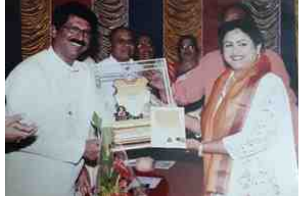
खासदार अरविंद सावंत यांच्या हस्ते राज्यस्तरीय रणरागिणी पुरस्कार स्वीकारताना

प्रसारमाध्यमांमध्ये काम करताना वेळेच्या नियोजनाबाबत अधिक काटेकोर झाले. print media मध्ये तुम्ही तासानुसार वेळापत्रक आखून काम करता, तेच इलेक्ट्रॉनिक मिडीयामध्ये, आकाशवाणी, दूरदर्शनमध्ये सेकंदांनुसार करावं लागतं. तुम्हाला जास्त update रहावं लागतं. आकाशवाणी पुणे केंद्रावरून सकाळी ७ वाजून १० मिनिटांनी प्रादेशिक बातमीपत्र प्रसारित होतं. त्यासाठी वृत्तनिवेदक स्टुडीओमध्ये ७.०० वाजता हजर असावा लागतो. त्यापूर्वी त्याला वाचनासाठी, सरावासाठी पुरेसा वेळ मिळावा म्हणून अर्धा तास आधी बातमीपत्र तयार असावं लागतं. ते वेळेत पूर्ण होण्यासाठी त्याचं काम आम्हाला पहाटे पाचला सुरू करावं लागतं. इकडे-तिकडे वेळ घालवायला तिथे जागाच नाही. जे काही आहे ते आत्ता आणि या क्षणी. दुसरं म्हणजे निर्णय घेण्याची क्षमता