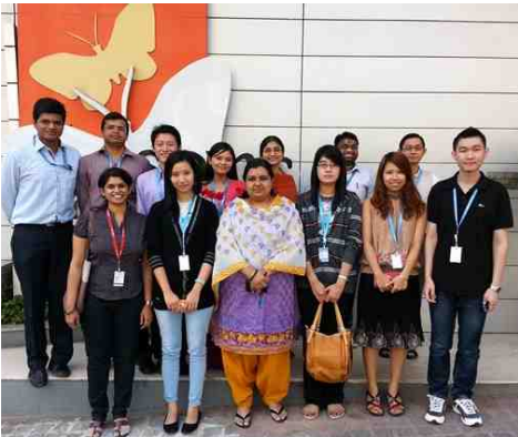
म्यानमार आणि भारतीय टीम

दक्षिण आशियाई देश (म्यानमार, व्हिएतनाम इत्यादी), भारत आणि जपान या टीमचा एक मोठा R& D प्रोजेक्ट देखील माझ्या टीमने केला, ज्या अंतर्गत या देशांमधील कार्यपद्धतीचा तपशीलवार तुलनात्मक अभ्यास केला. प्रत्येक देशाच्या टीमच्या क्षमता अभ्यासून आंतरराष्ट्रीय टीम तयार केल्या. याच सुमारास कंपनीचे म्यानमारमधील सेंटर संपूर्ण उभारून दिले. यांगोन (म्यानमार), पुणे (भारत) आणि तोक्यो (जपान) इथून coordinate करून म्यानमारमधील teams select करणे, त्यांचं प्रशिक्षण आणि प्रकल्प सुरू करून देणे, आणि इतर related management activities यात माझा सहभाग होता.