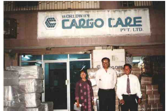
दुभाषी म्हणून काम करताना