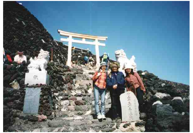
माऊंट फुजी येथील ज्वालामुखीचे विवर