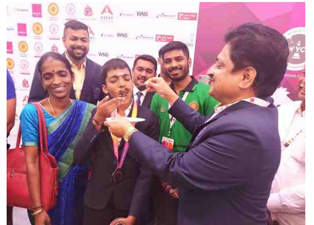
इंडियन ग्रॅंड मास्टर प्रग्यानंद, चॅम्पियन ऑफ द टूर्नामेंट